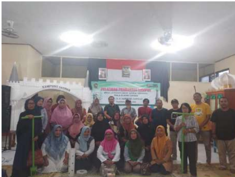
Gambar 3 Pelatihan Pemasangan RW 04,05,06, 12 Juni 2024