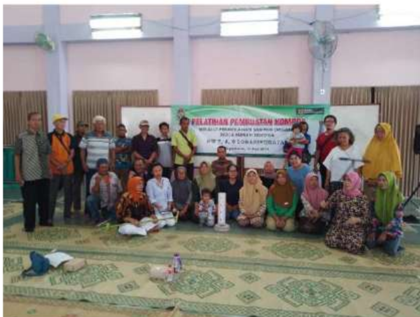
Gambar 6 Pelatihan Pemasangan RW 07,08,09 13 Juni 2024