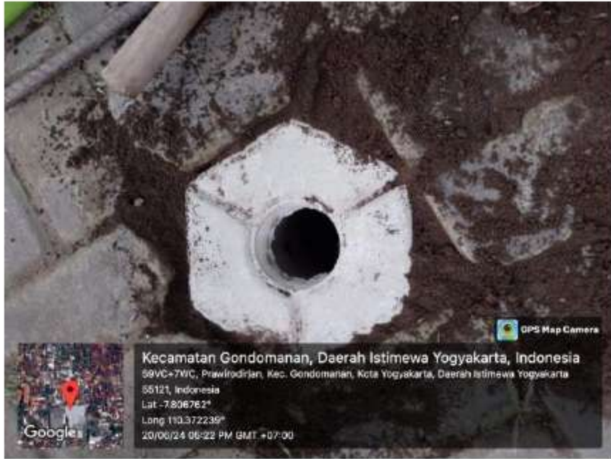
Gambar 11 Pelatihan Pemasangan RW 11, 19 Juni 2024