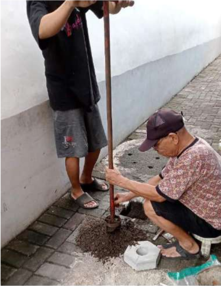
Gambar 1 Pelatihan Pemasangan RW 01,02,03 13 Juni 2024