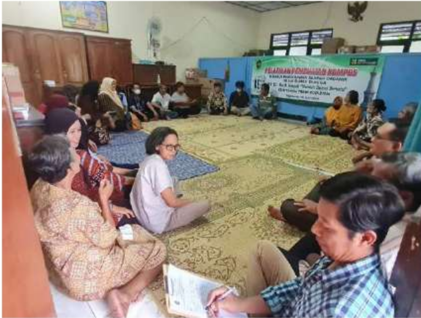
Gambar 9 Pelatihan Pemasangan RW 10, 18 Juni 2024