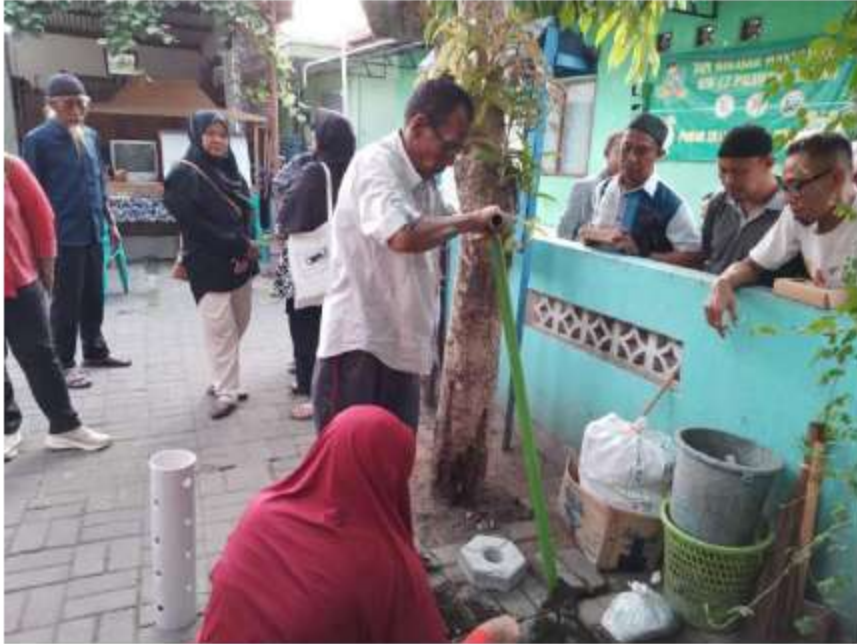
Gambar 7 Pelatihan Pemasangan RW 10, 18 Juni 2024