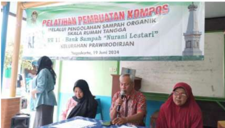
Gambar 10 Pelatihan Pemasangan RW 11, 19 Juni 2024