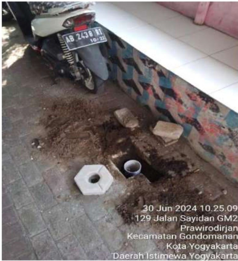
Gambar 4 Pelatihan Pemasangan RW 04,05,06, 12 Juni 2024