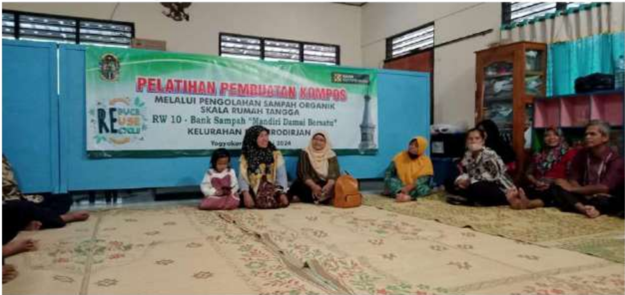
Gambar 8 Pelatihan Pemasangan RW 10, 18 Juni 2024