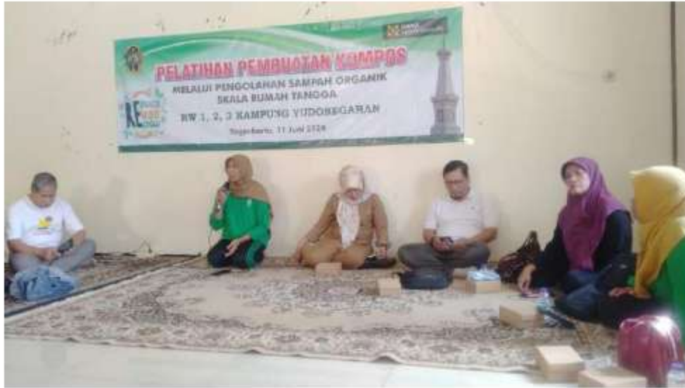
Gambar 2 Pelatihan Pemasangan RW 01,02,03 13 Juni 2024