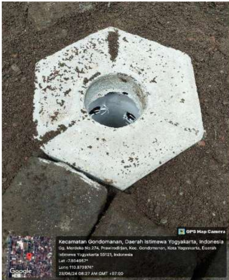
Gambar 5 Pelatihan Pemasangan RW 07,08,09 13 Juni 2024